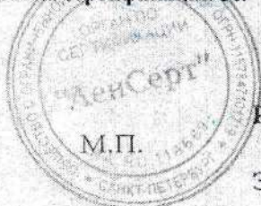
Схема сертификации 3с.